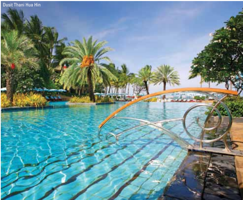
Dusit Thani Hua Hin

Lige fra I træder ind i receptionen på dette legendariske badehotel, kan I se, det er noget særligt. Her er tale om et 5-stjernet resort - det er ikke nyt, men er løbende renoveret. Indretning, faciliteter og betjening lever fuldt op til den høje popularitet og de talrige priser, hotellet har vundet. Alle værelser vender helt eller delvist mod havet, og det samme gør den ene af de to swimmingpools, hotellet kan tilbyde. Den anden swimmingpool er med saltvand og placeret i en stille have til dem, der foretrækker fred og ro. Alle superior-værelser er yderst rummelige og pænt indrettede, har alle moderne faciliteter, samt balkon, der vender ud mod poolen og begrænset havudsigt. Hotellet tilbyder alle former for aktiviteter: Tennis, squash, ridning, fitnesscenter og et stort udvalg af vandsport. Tæt på ligger flere golfbaner i topklasse, som hotellet gerne hjælper til med at booke. Der er flere forskellige restauranter på hotellet - både italiensk, fransk og thailandsk, og chefkokken, som er fransk, har været på hotellet i næsten 20 år og sørger for, at maden lever op til den høje standard, som findes overalt. Dusit Thani Hua Hin ligger 10 minutters kørsel nord for Hua Hin og tilbyder shuttle-bus service hver time (50 baht pr. vej). På den måde er det nemt at komme til f.eks. det berømte natmarked i Hua Hin, men samtidig at kunne trække sig tilbage og nyde freden på den private strand ved hotellet.