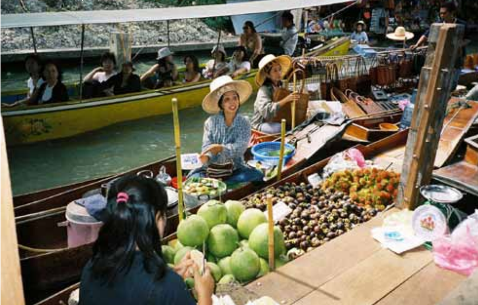
Damnoen Saduak (flydende marked)