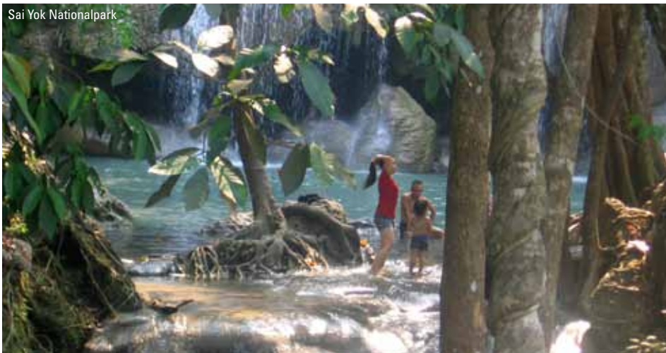
Sai Yok Nationalpark

I kan tilmelde jer arrangementet på dagen. Prisen for at deltage er ca. kr. 300,- pr. person, der betales til rejselederen.